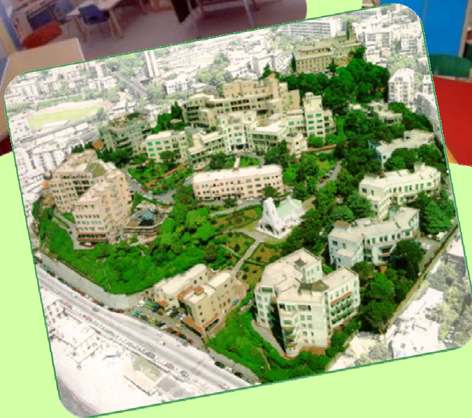
Istituto Pediatrico Giannina Gaslini